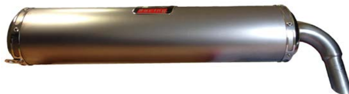
PHOTO DE CÔTÉ PHOTO OF THE SIDE

Signature et tampon de l'ASN Signature and stamp of the ASN